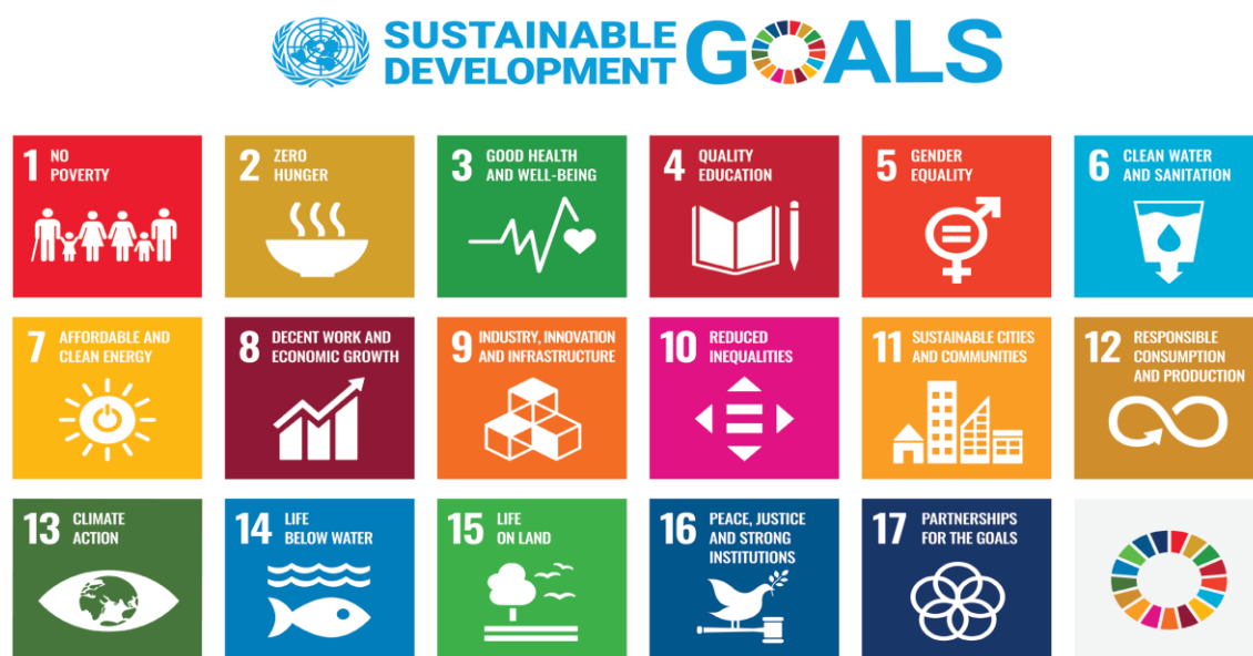
Figuur 1. De SDG's (SustainableDevelopment Goals of Duurzame Ontwikkelingsdoelen) zijn zeventien doelen om van de wereld een betere plek te maken in 2030. De SDG's zijn bepaald door de Verenigde Naties (VN).

Bedrijven die bijdragen aan één of meerder van de 17 duurzame ontwikkelingsthema's van de Verenigde Naties en die een hoge ESG-score hebben ontvangen, nadat ze zijn (branche of sector specifiek) geanalyseerd door speciale duurzame rating-bedrijven worden opgenomen in een duurzame index en vervolgens dus in diverse hierop gebaseerde ETF's.